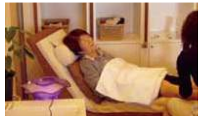
アロママッサージははじめました 癒されています！

ご入居されている方々には十人十色のライフスタイルがあり、私たちがスタッフは日々の生活をお手伝いする中で学ぶことも多くあります。これからも、会話を重ねながら一緒に居心地のよい住まいについて考えていきたいと思えます。(ケアスタッフより)