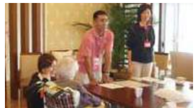
訪問歯科による口腔ケアの指導風景 毎日のケアが大切です！

その他、月によって三線や琴や歌謡などのボランティアの方々による演奏なども実施しています。