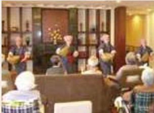
琉球舞踊 琉球舞踊を披露していただきました