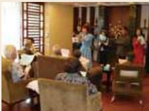
歌謡ショー！ 歌って踊って盛り上がりました！