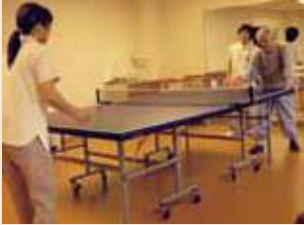
卓球が人気！ つつい力が入ってしまうようです