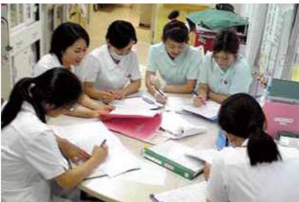
『患者さんのより良い医療・環境を目指し、 日々話し合いを重ねています』

今ですが、戦後、大変な 苦勞をされて、現在の 沖繩を残してくれたお年 寄りの方の、安らかな 老後のために、職員一 同努力を続けます。